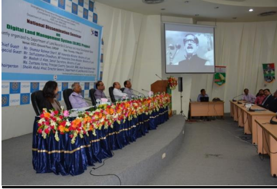
সিরডাপ মিলনায়তনে ১৮ মে, ২০১৭ অনুষ্ঠিত ডিএলএমএস প্রকল্প বিষয়ক জাতীয় সেমিনার