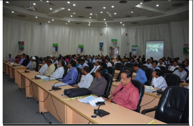
সিরডাপ মিলনায়তনে ১৮ মে, ২০১৭ অনুষ্ঠিত ডিএলএমএস প্রকল্প বিষয়ক জাতীয় সেমিনার