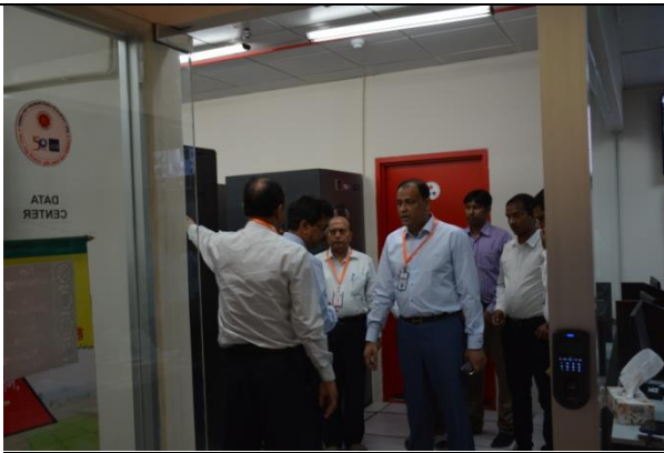
মাননীয় ভূমি প্রতিমন্ত্রী জনাব মোঃ সাইফুজ্জামান চৌধুরী কর্তৃক ১১ এপ্রিল ২০১৭ তারিখে ভূমি রেকর্ড ও জরিপ অধিদপ্তরের কেন্দ্রীয় ডাটা সেন্টার পরিদর্শন