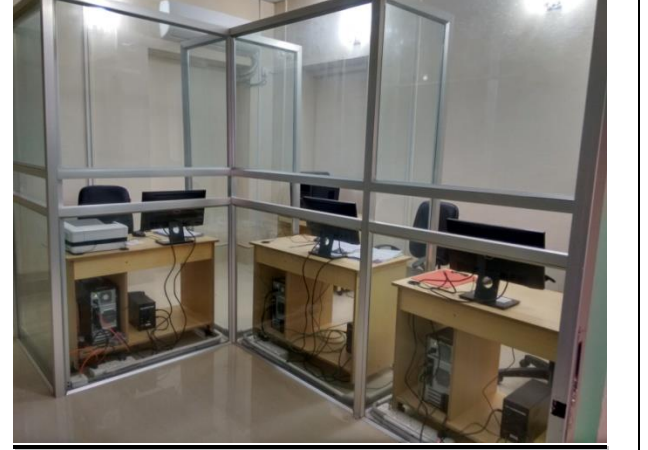
ডিএলএমএস প্রকল্পের মাধ্যমে বদলে যাওয়া উপজেলা ভূমি অফিস