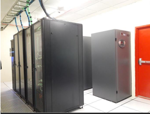
ভূমি রেকর্ড ও জরিপ অধিদপ্তরে নির্মিত সেন্ট্রাল ডাটা সেন্টার