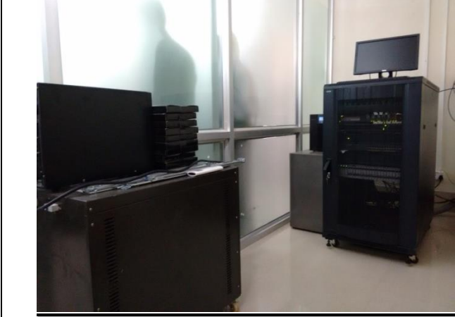
উপজেলা ভূমি অফিসে স্থাপিত সার্ভারসহ আইটি যন্ত্রপাতি