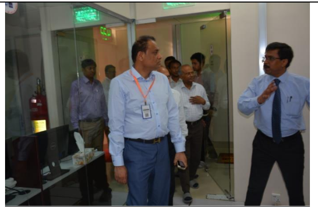
মাননীয় ভূমি প্রতিমন্ত্রী জনাব মোঃ সাইফুজ্জামান চৌধুরী কর্তৃক ১১ এপ্রিল ২০১৭ তারিখে ভূমি রেকর্ড ও জরিপ অধিদপ্তরের কেন্দ্রীয় ডাটা সেন্টার পরিদর্শন